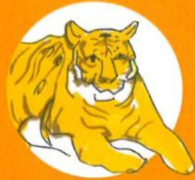
珍品名稱： 雪野雙雄圖 朝代：約 1930 年代

是次比賽要求參加者參考香港藏家們 熱心捐贈予香港故宮文化博物館的私人珍藏， 讓學生體會藏家收藏文物的壯懷和他們實踐傳承的使命， 並與公眾分享他們宣揚中華文化的熱情， 從而推動社會肩負文化傳承的任務。