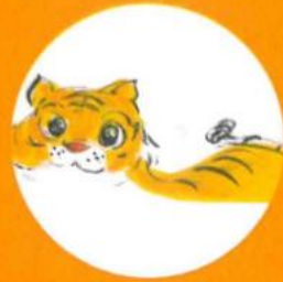
珍品名稱： 伴侶圖 朝代：約 1930 年代