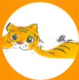
珍品名稱： 伴侶圖 朝代：約 1930 年代