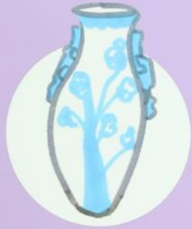
珍品名稱： 花卉圖雙耳瓶 朝代：清嘉慶（1796-1820年）