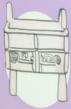
珍品名稱： 獸面紋方鼎 朝代：商代晚期至西周早期， 約公元前12至公元前11世紀

是次比賽要求參加者參考香港藏家們 熱心捐贈予香港故宮文化博物館的私人珍藏， 讓學生體會藏家收藏文物的壯懷和他們實踐傳承的使命， 並與公眾分享他們宣揚中華文化的熱情， 從而推動社會肩負文化傳承的任務。