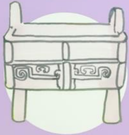
珍品名稱： 獸面紋方鼎 朝代：商代晚期至西周早期， 約公元前12至公元前11世紀

是次比賽要求參加者參考香港藏家們熱心捐贈予香港故宮文化博物館的私人珍藏，讓學生體會藏家收藏文物的壯懷和他們實踐傳承的使命，並與公眾分享他們宣揚中華文化的熱情，從而推動社會肩負文化傳承的任務。