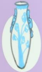
珍品名稱： 花卉圖雙耳瓶 朝代：清嘉慶（1796-1820年）